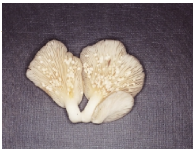
ヒラタケ白こぶ病

しかし、ヒラタケを野外で栽培すると、ときにヒラタケ白こぶ病が発生します。ヒラタケ白こぶ病は、ヒラタケのヒダに白いこぶ状の組織が生じる病気です。この病気は、ナミトモナガキノコバエが運ぶ線虫の一種によって生じることが知られています。キノコは普通に育ちますが、病害がひどい場合にはヒダ全体が白いこぶによって覆われてしまい、商品価値が低くなります。