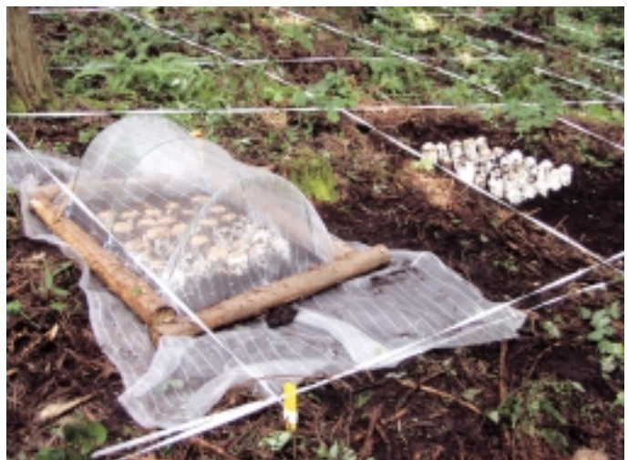
防虫ネットの被覆

ヒラタケ白こぶ病の防除を目的として、網目1mmの防虫ネットをトンネル掛けして防除の効果を調査しました。防虫ネットを被覆した場合、調査したいずれの場所とも、ほとんど白こぶ病は発生しませんでした。また、防虫ネットの被覆によって、キノコの発生量が減少することもほとんどないため、防虫ネットの被覆は、白こぶ病の防除方法として有効でした。防虫ネットの被覆によって、線虫を運ぶキノコバエをキノコに近づけないようにできたためと考えられます。