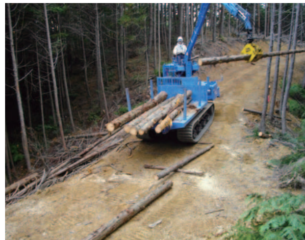
木材生産に活用されている作業道

このような被害を防ぐため、森林研究所では県内の路網開設地における濁水流出の実態を調査し、濁水流出を抑制するための路網開設技術の開発に取り組んでいます。