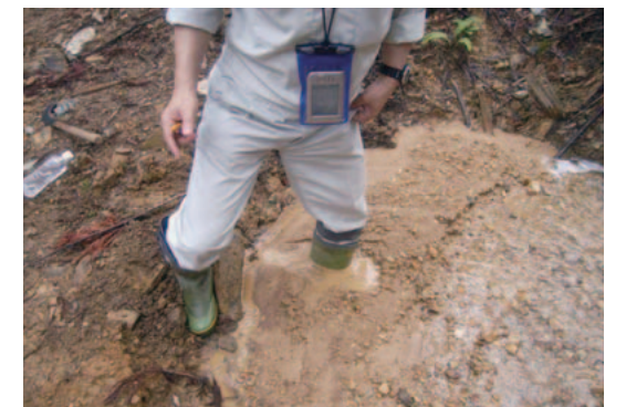
降雨後の沈砂池の状況

右の写真は前述の実態調査を行った路網開設地に作られた沈砂池の降雨後の状況です。大量の土砂が捕捉されており、下流への濁水流出を防いでいると予想されます。今後はこういった対策の効果を詳しく検証し、濁水流出を抑制するための路網開設技術の開発を進めていきたいと考えています。