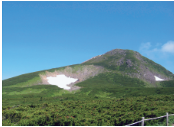
写真1 高山帯のハイマツの下にも土壌は分布します (大野郡白川村 白山)

生物に種類があり名前があるように、土壌も生い立ちやもとになった母材(岩石)、乾湿の状態などによって、いくつかの種類に分けられます。森林内にみられるいろいろな種類の土壌を、種類ごとにまとめて図化したのが森林土壌図です。