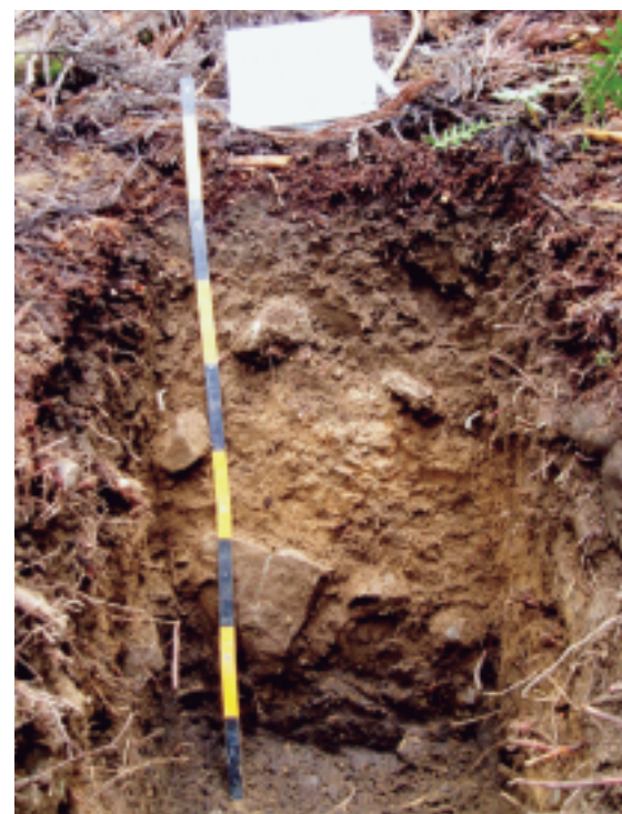
写真2 森林の下に生成される代表的な土壌の断面 (郡上市大和町のスギ林の適潤性褐色森林土壌)

土壌図は、これらふたつの調査結果に加え、地質、地形、植生などの情報を加味することによって、土壌の種類を地形図の上で 点から面へ引き延ばす作業 によって作成されます。